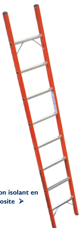
Version isolant en composite ➤