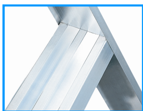
Marches antidérapantes 83mm