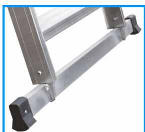
Barre stabilisatrice horizontale