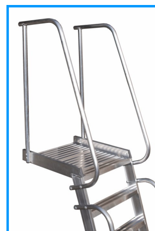
Option : palier de sortie frontale