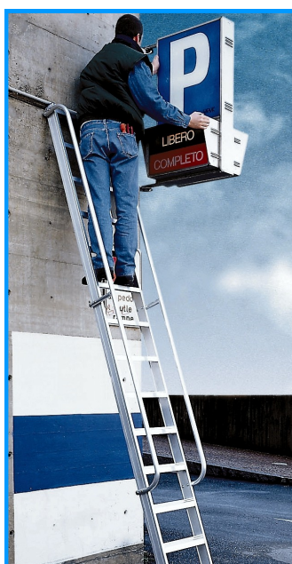
Option : main-courante