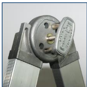
Articulation en alliage