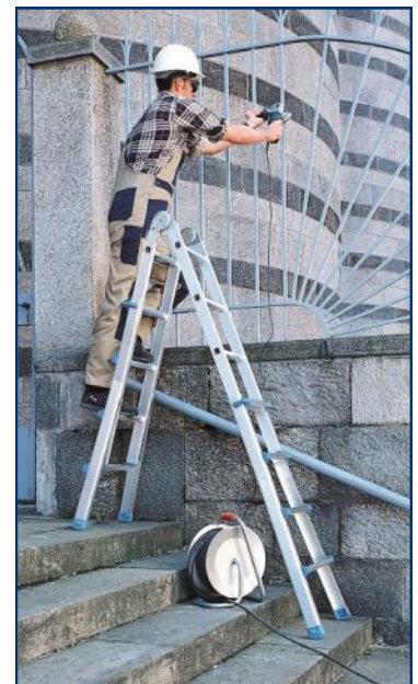
Installation en dénivelés