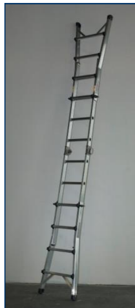
Position : échelle droite