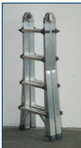
Facilité de transport et stockage