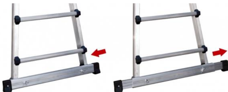
Barre stabilisatrice télescopique