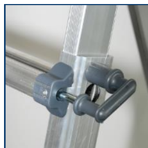
Poignée de blocage