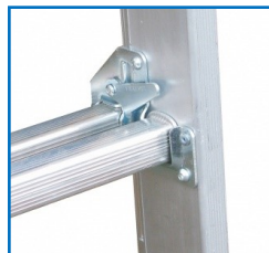
Crochets anti-soulèvement Verrouillage automatique des plans