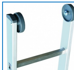
Roulettes de façade