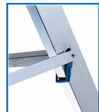
Barre aluminium anti-écartement